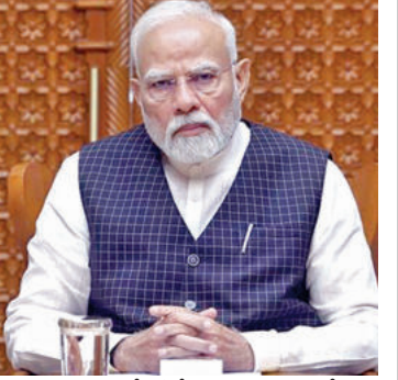
భద్రతా కమిటీ ఖవీద్ ప్రధాని మోడీ

పాక్ ప్రజలకు భారత్ లో ప్రవేశం లేదు పాకిస్తాన్ పౌరులు 48 గంటల్లోపు దేశం వీడి వెళ్లాలిందే.. సార్వీసా ఉన్న పాక్ పౌరులు కూడా వెళ్లాలిందే.. ఇండస్ నదీజలాల ఒప్పందం రద్దు రాయబార కార్యాలయాల్లో సిబ్బంది కుదింపు భద్రతా వ్యవహారాల కేబినెట్ కమిటీ నిర్ణయాలు న్యూఢిల్లీ: జమ్మూకాశ్మీర్ లోని పహల్గాంజ్ జిల్లాలోని పాక్ ఉగ్రవాదుల దాడిపై కేంద్ర రక్షణ మంత్రి రాజీనాథ్ సింగ్ తీవ్ర ఆగ్రహం వ్యక్తం చేశారు. భారత్ పై కుట్టుల పన్నవారిని ఊరికే వదలబోమన్నారు. దాడికి భారత్ గట్టి >>2