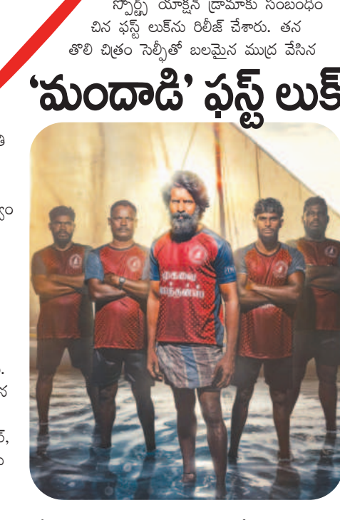
మందాడి ఫస్ట్ లుక్

అతని రేటర్లో ఒక ప్రత్యేక మైలురాయి చిత్రంగా నిలుస్తుంది. ఈ చిత్రంలో అతని నటన మాత్రమే కాకుండా ఆహార్యం, లుక్, మేకప్ లో సూరికి కూడా అందరినీ ఆకర్షిస్తున్నాను. మీదుగా ముత్తయ్య సినిమా నుంచి సినిమాల యాక్ట్ జే.. పాటను రిలీజ్ చేశారు. ఈ పాట లాంఛ్ చేయడం సంతోషంగా ఉందని, ఎన్ని