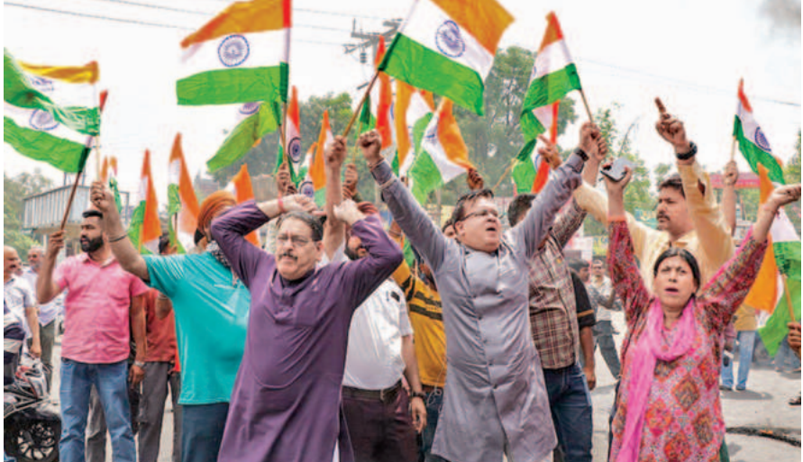
పహలాంను ఉగ్రవాద దాడికి వ్యతిరేకంగా బుధవారం జమ్మూలో జాతీయ జెండాలతో నినాదాలు చేస్తున్న ప్రజలు