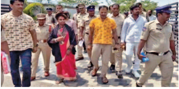
బుధవారం నార్సింగి ఓసిన కార్యక్రమం నుంచి అభ్యోగి రిమాండ్ కు తరలింస్తున్న మోకల పోలీసులు