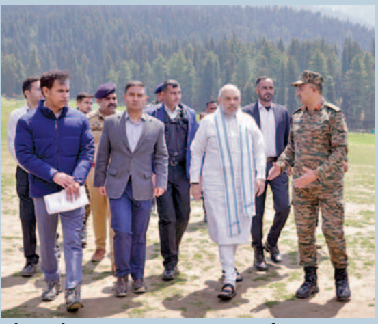
శ్రీనగర్లో పహలాం ఉగ్రవాద దాడి జరిగిన ప్రదేశాన్ని బుధవారం పరిశీలిస్తున్న కేంద్ర హోంమంత్రి అమిత్ షా, ఆర్మీ ఉన్నతాధికారులు