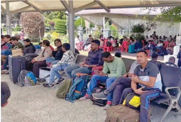
శ్రీనగర్ లో బుధవారం సొంత ఊళ్లకు వెళ్లడానికి వేచి ఉన్న టూరిస్టులు

అదనపు సర్వీసులను అందుబాటులోకి తెచ్చారు. టికెట్ డ్రగరలు పెంచవద్దనకూడా సంస్థలను ఆదేశించారు. ఇప్పటికే అన్ని ఎయిర్ లైన్లు టికెట్ క్యాన్సిల్ చేసే రీషెడ్యూలు కార్డులను రద్దుచేసాయి. ఈ వివరాలను సీనియర్ పర్యాటకులకు అందగా నిలవాలని కేంద్ర మంత్రి తన పోస్టల్ పేర్లొచ్చారు. తాజా పరిణామాలపై జమ్మూకాశ్మీర్ సీఎం సీరు దించారు. కాశ్మీర్ లోయనుంచి అతిథులు వెళ్లిపోతోంటే నా గుండె పగులుతున్నదని అన్నారు. పర్యాటకులు తిరుగుప్రయాణంకోసం అన్ని ఏర్పాట్లుచేస్తున్నారు. కేంద్రం ఏర్పాటుచేసిన అదనపు సౌకర్యాల కల్పించామని సీఎం వెల్లడించారు.